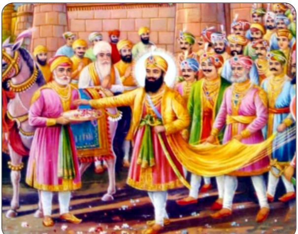
ਸ਼੍ਰੀ ਗੁਰੂ ਹਰਿਗੋਬਿੰਦ ਸਾਹਿਬ ਸਬੰਧੀ ਜਾਣਕਾਰੀ ਦਿੱਤੇ ਜਾਣ 'ਤੇ ਉਸ ਨੇ ਗੁਰੂ ਸਾਹਿਬ ਨੂੰ ਰਿਹਾਅ ਕਰਨ ਦਾ ਫ਼ਰਮਾਨ ਜਾਰੀ ਕਰ ਦਿੱਤਾ। ਪ੍ਰੰਤੂ ਗੁਰੂ ਹਰਿਗੋਬਿੰਦ ਸਾਹਿਬ ਨੇ ਇਕੱਲਿਆਂ ਕਿਲ੍ਹੇ ਵਿਚੋਂ ਰਿਹਾਅ ਹੋਣਾ ਸਵੀਕਾਰ ਨਾ ਕੀਤਾ। ਗੁਰੂ ਸਾਹਿਬ ਦੀ ਹਰਿਮਤ ਸਦਕਾ ਕਿਲ੍ਹੇ ਵਿਚ ਨਜ਼ਰਬੰਦ 52 ਰਾਜਪੂਤ ਰਾਜਿਆਂ ਨੂੰ ਵੀ ਬੰਦੀਖਾਨੇ ਤੋਂ ਮੁਕਤੀ ਮਿਲੀ।

ਓਹਰ ਗੁਰੂ ਸਾਹਿਬ ਦੀ ਨਜ਼ਰਬੰਦੀ ਲੰਬੀ ਹੋ ਜਾਣ ਕਾਰਨ ਸਿੱਖਾਂ ਵਿਚ ਬੇਚੈਨੀ ਵਧਣ ਲੱਗੀ। ਬਾਬਾ ਬੁੱਢਾ ਜੀ ਦੀ ਅਗਵਾਈ 'ਚ ਸਿੱਖ ਸੰਗਤਾਂ ਦਾ ਇਕ ਜਥਾ ਸ੍ਰੀ ਅਕਾਲ ਤਖ਼ਤ ਸਾਹਿਬ ਤੋਂ ਅਰਦਾਸ ਕਰਕੇ ਗਵਾਲੀਅਰ ਲਈ ਰਵਾਨਾ ਹੋਇਆ। ਜਿੱਥੋਂ-ਜਿੱਥੋਂ ਇਹ ਜਥਾ ਕੀਰਤਨ ਕਰਦਾ ਹੋਇਆ ਗੁਜ਼ਰਦਾ, ਸਿੱਖ ਸੰਗਤਾਂ ਇਸ ਦਾ ਭਾਰੀ ਸਵਾਗਤ ਕਰਦੀਆਂ। ਜਦੋਂ ਇਹ ਜਥਾ ਗਵਾਲੀਅਰ ਦੇ ਕਿਲ੍ਹੇ ਪਹੁੰਚਿਆ ਤਾਂ ਸੰਗਤਾਂ ਨੂੰ ਗੁਰੂ ਸਾਹਿਬ ਨਾਲ ਮੁਲਾਕਾਤ ਜਾਂ ਦਰਸ਼ਨ ਕਰਨ ਦੀ ਇਜ਼ਾਜ਼ਤ ਨਾ ਮਿਲ ਸਕੀ। ਪਰ ਇਹ ਜਥਾ ਕੀਰਤਨ ਕਰਦਿਆਂ, ਗਵਾਲੀਅਰ ਦੇ ਕਿਲ੍ਹੇ ਦੀਆਂ ਪੁਕਰਮਾ ਕਰਕੇ ਗੁਰੂ ਸਾਹਿਬ ਨੂੰ ਸਤਿਕਾਰ ਭੇਟ ਕਰ ਵਾਪਸ ਮੁੜ ਆਇਆ। ਮੁਸਲਿਮ ਸੂਫੀ ਸੰਤ ਸਾਈਂ ਮੀਆਂ ਮੀਰ ਜੀ ਵੱਲੋਂ ਬਾਦਸ਼ਾਹ ਜਹਾਂਗੀਰ ਨੂੰ