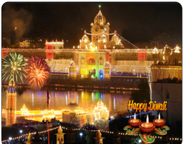
ਗੁਰੂ ਸਾਹਿਬ ਦੀ ਨਜ਼ਰਬੰਦੀ ਕੋਈ ਸਾਧਾਰਨ ਗੱਲ ਨਹੀਂ ਸੀ। ਸਿੱਖ ਸੰਗਤਾਂ ਲਈ ਇਹ ਖਬਰ ਬੜੀ ਹਿਰਦੇ ਵੇਦਕ ਸੀ। ਪਰ ਗੁਰੂ ਸਾਹਿਬ ਦੇ ਪਹੁੰਚਣ ਨਾਲ ਗਵਾਲੀਅਰ ਦੇ ਕਿਲ੍ਹੇ ਦਾ ਮਾਹੌਲ ਹੀ ਬਦਲ ਗਿਆ ਜਿਥੇ ਦੋਵੇਂ ਵੇਲੇ ਕੀਰਤਨ ਅਤੇ ਸਤਿਸੰਗ ਹੋਣ ਲੱਗਾ ਅਤੇ ਕਾਲ-ਕੋਠੜੀਆਂ ਵਿਚੋਂ ਪ੍ਰਭੂ-ਸਿਮਰਨ ਦੀਆਂ ਮਿੱਠੀਆਂ ਧੁਨਾਂ ਉੱਠਣ ਲੱਗੀਆਂ। ਗੁਰੂ ਸਾਹਿਬ ਦੀ ਸੰਗਤ ਅਤੇ ਉਪਦੇਸ਼ਾਂ ਨੇ ਸਭ ਬੰਦੀਆਂ ਨੂੰ ਚੜ੍ਹਦੀ ਕਲਾ ਵਿਚ ਲੈ ਆਂਦਾ।

ਗੁਰੂ-ਘਰ ਦੇ ਵਿਰੋਧੀਆਂ ਨੇ ਗੁਰੂ ਸਾਹਿਬ ਵਿਰੁੱਧ ਬਾਦਸ਼ਾਹ ਜਹਾਂਗੀਰ ਦੇ ਕੰਨ ਭਰਨੇ ਸ਼ੁਰੂ ਕਰ ਦਿੱਤੇ, ਜਿਸ ਦੇ ਫ਼ਲਸਰੂਪ ਛੇਵੇਂ ਪਾਤਸ਼ਾਹ ਸ਼੍ਰੀ ਗੁਰੂ ਹਰਿਗੋਬਿੰਦ ਸਾਹਿਬ ਨੂੰ ਬਰਾਬਰ ਦੇ ਝੂਠੇ ਦੋਸ਼ ਵਿਚ ਗਵਾਲੀਅਰ ਦੇ ਕਿਲ੍ਹੇ ਵਿਚ ਨਜ਼ਰਬੰਦ ਕਰ ਦਿੱਤਾ ਗਿਆ।